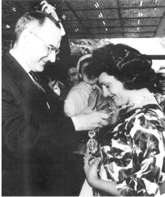
1969'da Amália, Brüksel Dünya Fuarı'nda Marcelo Caetano'dan nişan aldı.